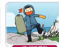
뱀, 벌레 물림