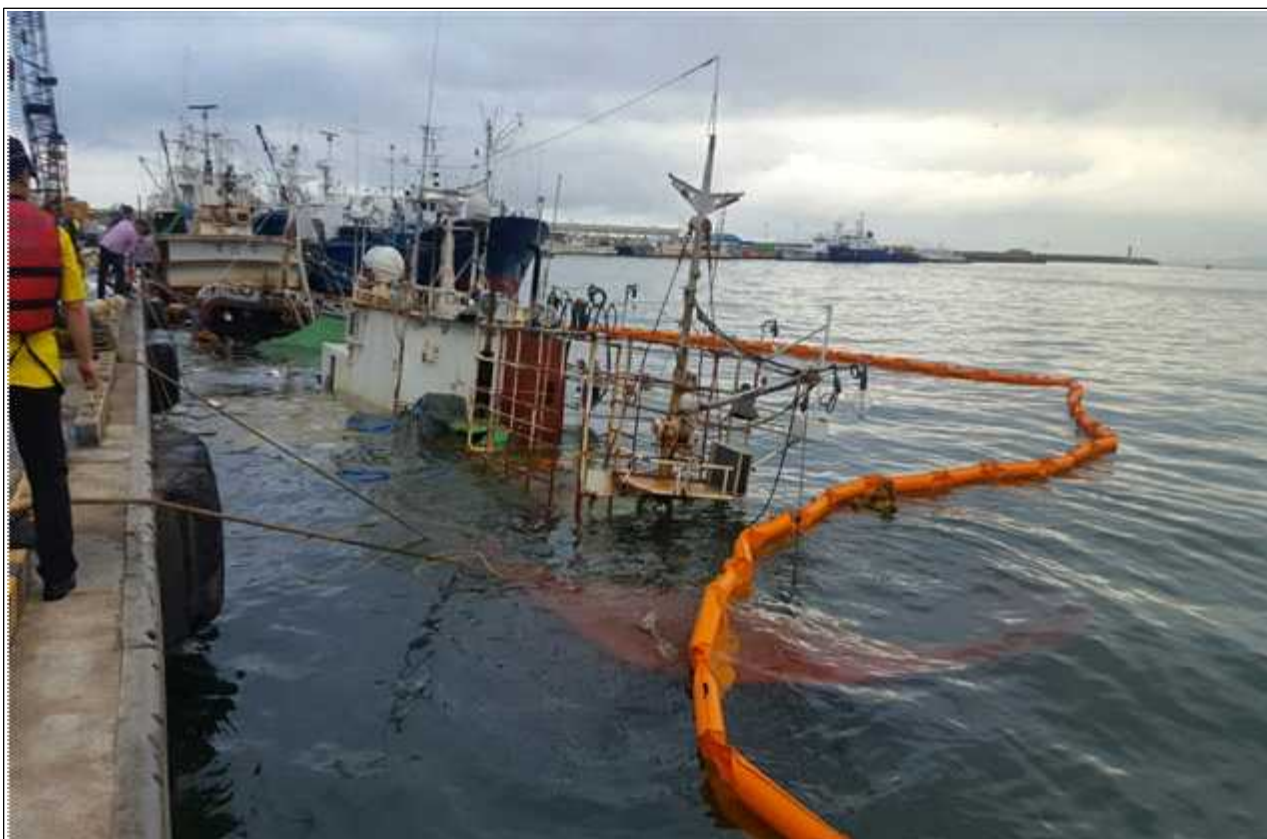
해양오염 방제 조치