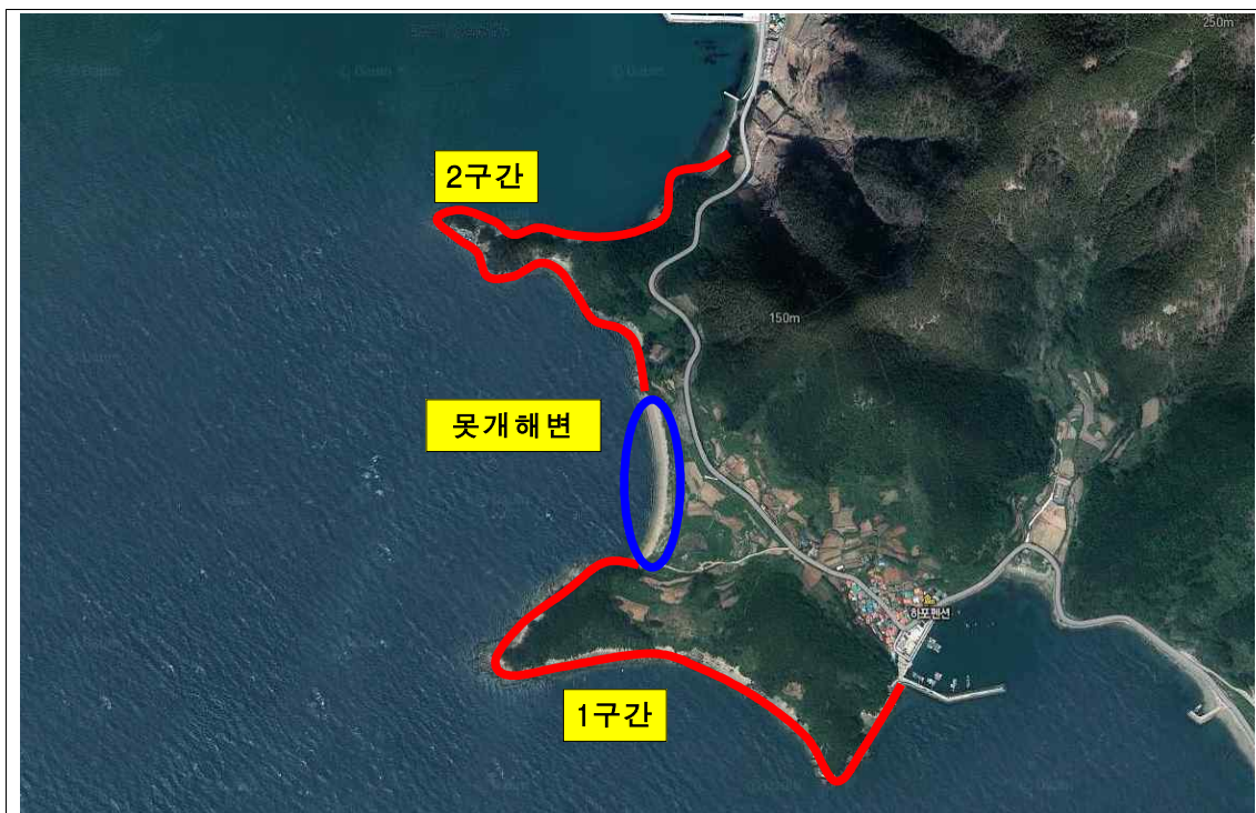
하포마을 지선 출입금지 구역(붉은색 선 : 출입금지 구역)