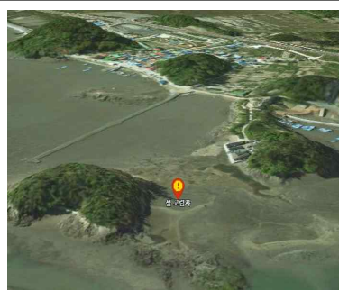
사건·사고 3차원 공간분석