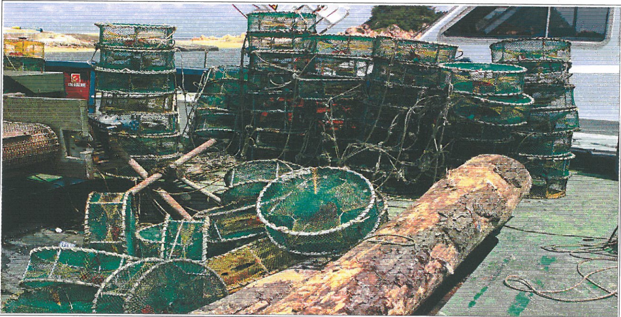
제4항로 주변 항행장애물 수거현장