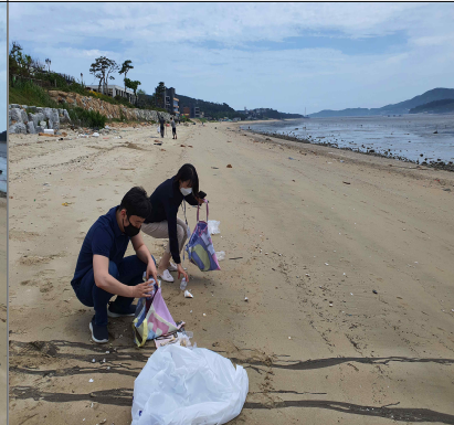
쓰레기 수거 모습