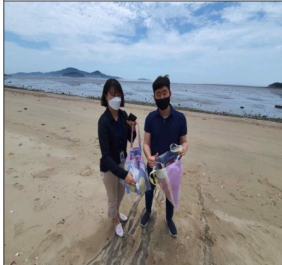
활동 후 수거된 쓰레기 포함 전경