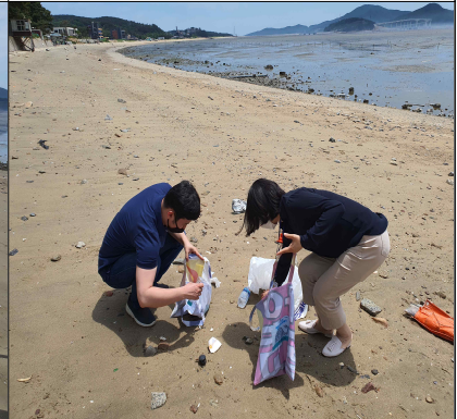
쓰레기 수거 모습

<주의사항 : 아래 조건에 맞지 않는 사진의 경우 봉사활동 인정이 불가합니다.>