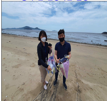
활동 후 수거된 쓰레기 포함 전경