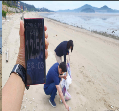
핸드폰 이용 활동의 시작 시간