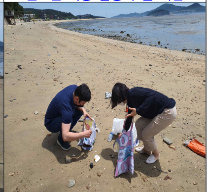
쓰레기 수거 모습

<주의사항 : 아래 조건에 맞지 않는 사진의 경우 봉사활동 인정이 불가합니다.>