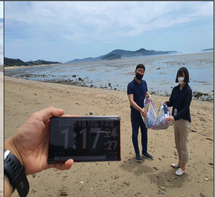
핸드폰 이용 활동의 끝 시간