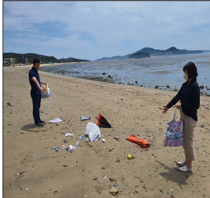
봉사 전 전경사진 촬영