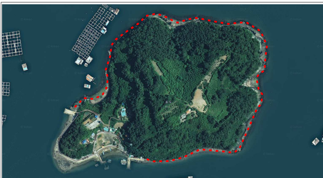
송도 지선 출입 금지 구역(붉은색 선 : 출입금지 구역)