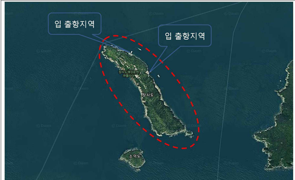
장사도 일원 출입 금지 구역(붉은색 선 : 출입금지 구역)

5. 벌칙사항 : 위반 시 자연공원법 제86조의 규정에 의한 50만원 이하의 과태료 부과